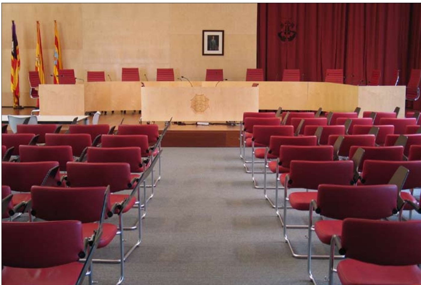
El PSM aposta per la participació en el procés per a l'elecció dels candidats al Consell i al Parlament a les properes eleccions de 2011.

Aturades les negociacions per a la reedició de la coalició amb Els Verds.